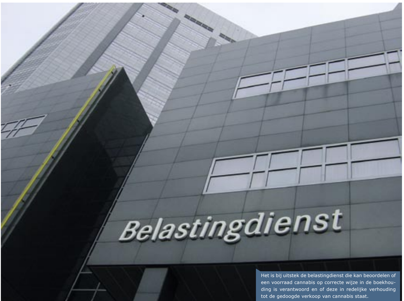
Het is bij uitstek de belastingdienst die kan beoordelen of een voorraad cannabis op correcte wijze in de boekhouding is verantwoord en of deze in redelijke verhouding tot de gedoogde verkoop van cannabis staat.

Hoe transparanter de coffeeshophouder zich jegens de overheid opstelt, hoe groter het risico is dat hij wordt opgespoord en bestraft. Dat wringt nu de gepubliceerde gedoogcriteria uitdrukkelijk geen voorwaarden stellen aan de maximaal per dag te verkopen hoeveelheid cannabis. De "500 gram norm" is